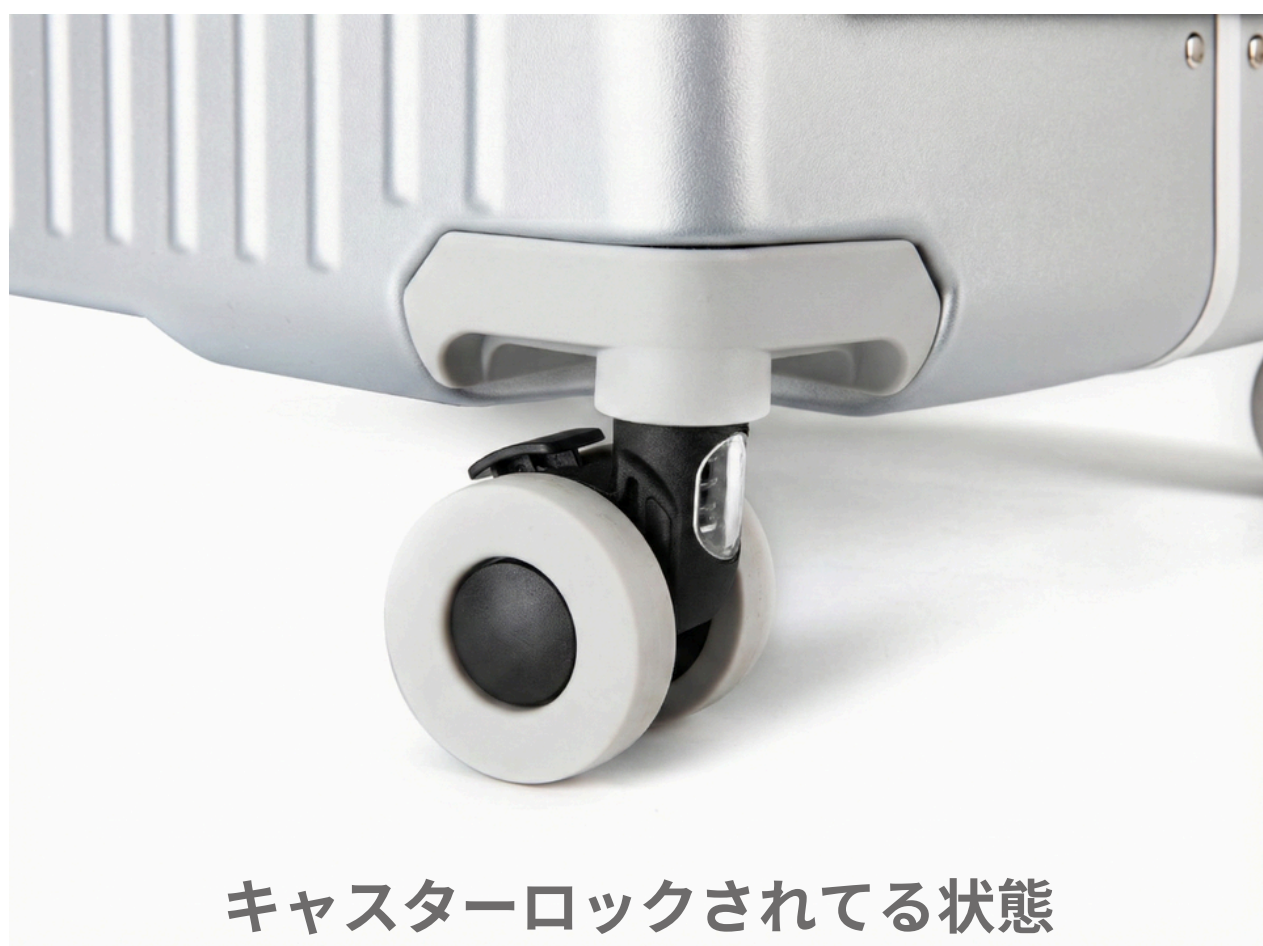
キャスターロックされてる状態